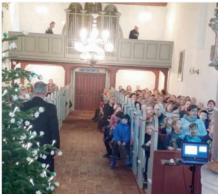
Rækker Mølle skolen i Hanning kirke den 20. december 2017.